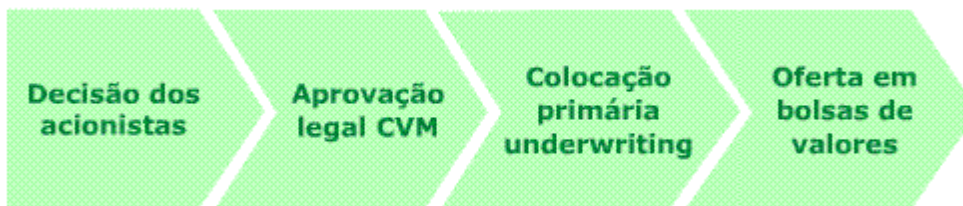
Diagrama 2 – Abertura de capital