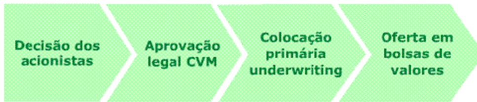
Diagrama 2. Abertura de capital